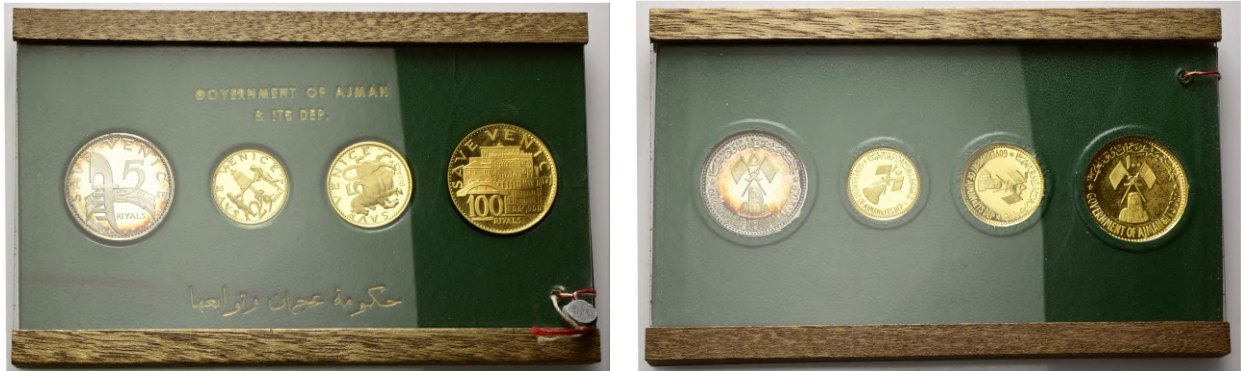
768 - 50%

768 Rashid Bin Humaid al-Nuaimi, 1928-1981. Proof Set 1971 "Save Venice" in oro ed argento comprendente: 100 Riyals (Canal Grande), 50 Riyals (Cavalli nella Basilica di San Marco), 25 Riyals (Campane di Bronzo in Piazza San Marco) e 25 Riyals in argento (Rashid Bin Hamad al - Naimi). Au e Ag gr. 20,7, gr. 10,35 e gr. 5,17 Fried. 4, 5 e 6; KM#27.